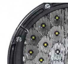
36 LEDS OSRAM