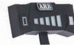
Variateur tactile 5 positions