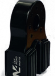
Type 10 T