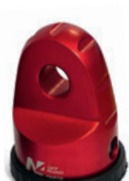
Type 8 T